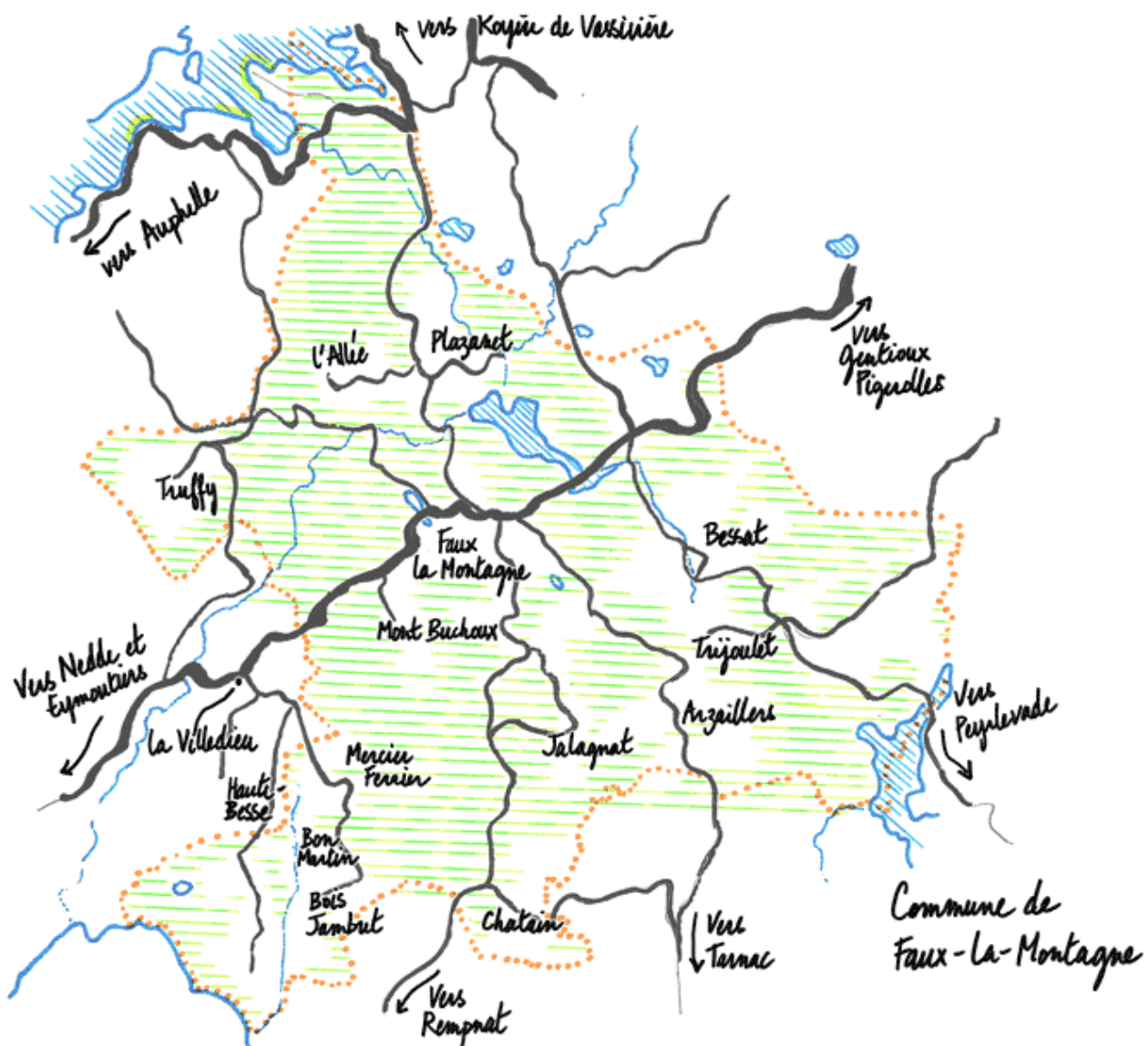
Plan de la commune et des villages